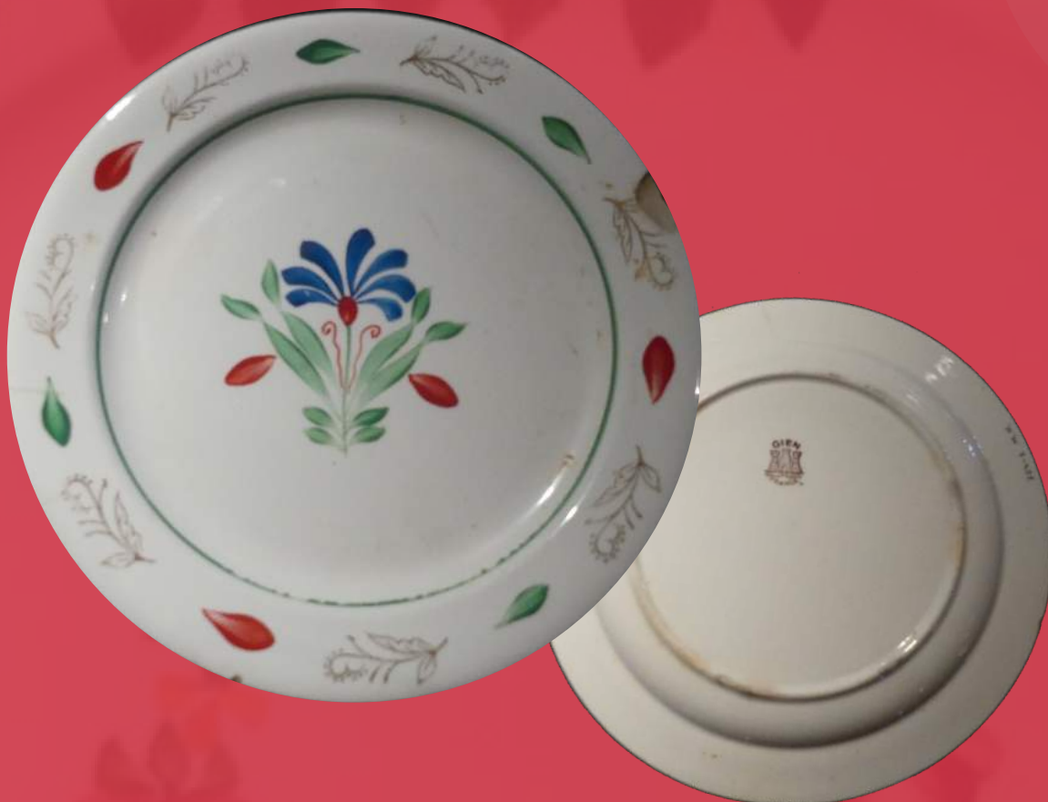
Gien eko zeramika. Ca. 1920 Cerámica de Gien Ca .1920.