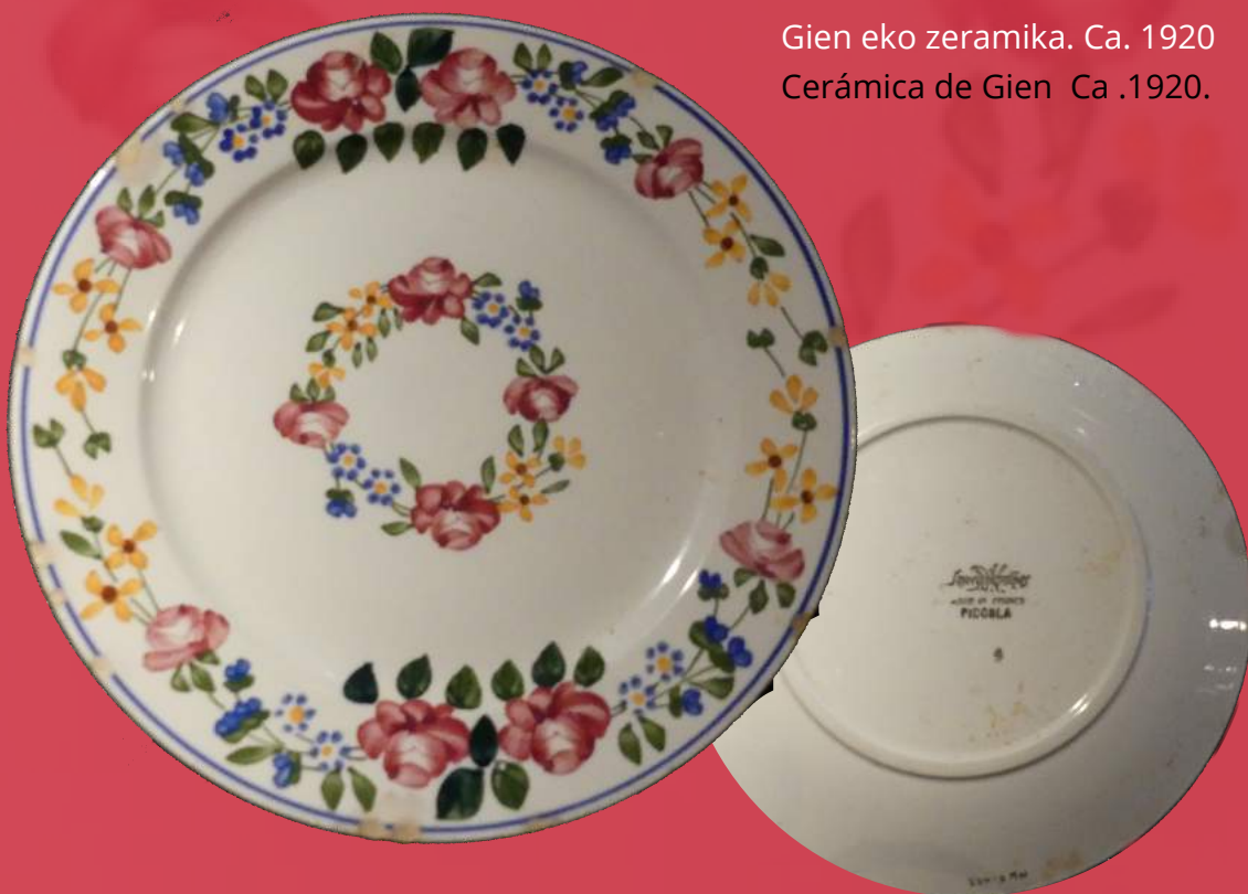
Sarraguemines eko zeramika. 1924. Cerámica de Sarraguemines. 1924.